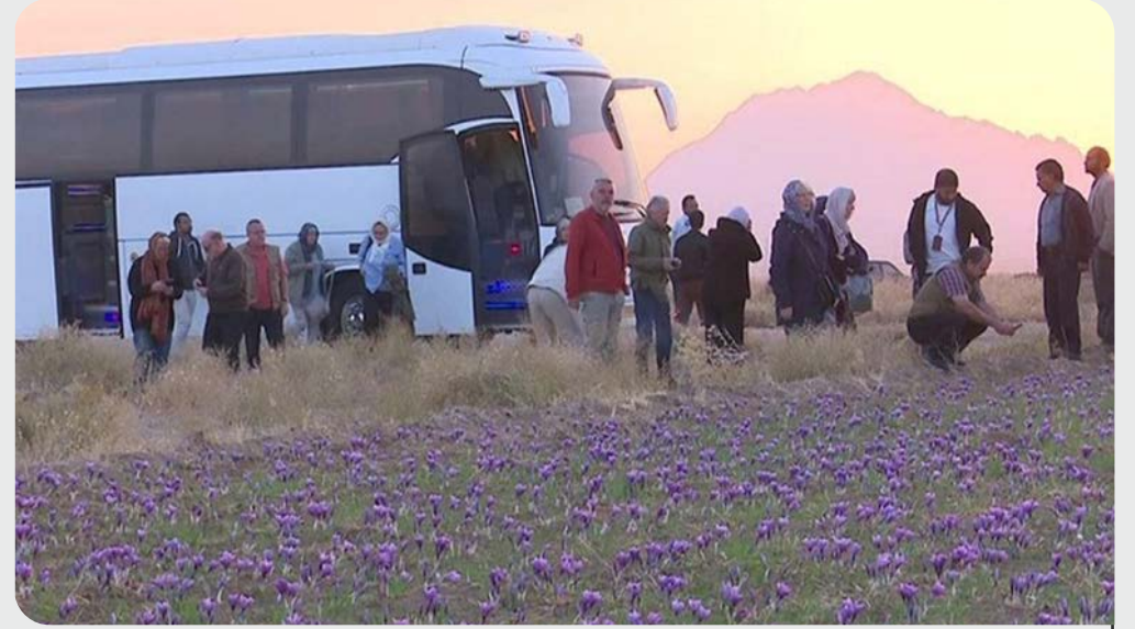
تصویر ۲. حضور گردشگران آلمانی در مزارع زعفران قاین

کشاورزی ایفا می‌کند و منافع آن متوجه سازمان‌دهندگان گردشگری محلی و جوامع بومی می‌شود. به‌همین دلیل متخصصان معتقدند توسعه گردشگری کشاورزی به توسعه‌ی چندمنظوره مناطق روستایی کمک می‌کند و تسهیل‌کننده دست‌یابی به توسعه‌ی پایدار کشاورزی و گردشگری سبز است.