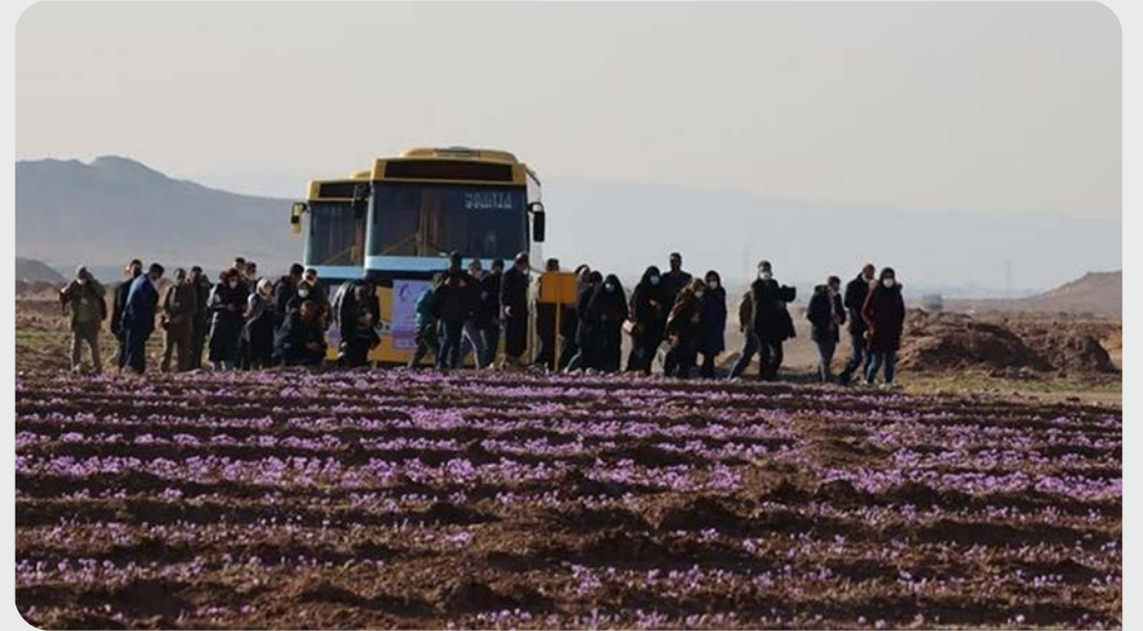
تصویر ۱. بازدید تورهای گردشگری تفریحی و علمی-پژوهشی از برداشت زعفران در منطقه تربت‌حیدریه (وب‌سایت باشگاه خبرنگاران جوان، ۱۴۰۰)

بر تولیدات کشاورزی خود سرمایه‌گذاری کند و در نوعی ارتباط بلاواسطه و مستقیم بین شخص ارائه‌دهنده خدمات (کشاورز و خانواده آن‌ها) و شخص درخواست‌کننده (گردشگر) محصولات کشاورزی خود را ارائه کند. یکی دیگر از ویژگی‌های غذای ارائه‌شده در صنعت کشاورزی این است که بر اساس غذاهای سنتی منطقه و از محصولات مزرعه‌ی خود مالک یا منطقه تهیه می‌شود، بنابراین از مزرعه و جامعه محلی پشتیبانی می‌کند. ۳. سرگرمی گردشگری: در مورد گردشگری کشاورزی، سرگرمی گردشگری بر اساس فعالیت‌هایی‌ست که به