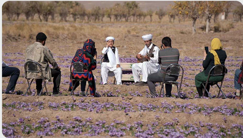
تصویر ۳. اجرای موسیقی محلی خراسانی در جشن برداشت زعفران تربت حیدریه (وب‌سایت شرکت زعفران مصطفوی، ۱۴۰۱)

در خانه‌ی کشاورز و کار در مزرعه کشاورزی می‌شود، جایی که نه تنها می‌توان استراحت کرد، غذاهای ارگانیک میل کرد، در کارهای میدانی مشارکت نمود و به تماشای تولید گیاه و دام‌داری مشغول شد، بلکه می‌توان در مزرعه و خارج از آن به فعالیت‌های تفریحی پرداخت. در تصاویر ۱ و ۲ نمونه‌هایی از گردشگری کشاورزی در مزارع زعفران تربت‌حیدریه و قاین ارائه شده است. امروزه، گردشگری کشاورزی از عناصر زیر تشکیل شده است: ۱. محل اقامت: کشاورز این امکان را دارد که از طریق اجاره‌ی اتاق‌های اضافی در خانه‌ی خود درآمد بیش‌تری کسب کند. ۲. غذا: کشاورز این فرصت را دارد که مستقیماً